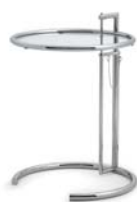
ADJUSTABLE TABLE E 1027 1927