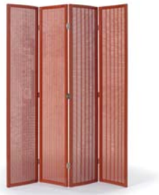
Chinarot china red